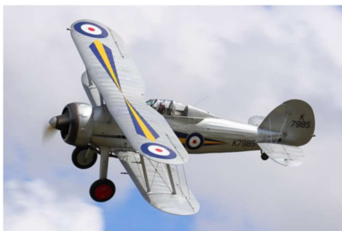
'n Gloster Gladiator in RAF Kentekens