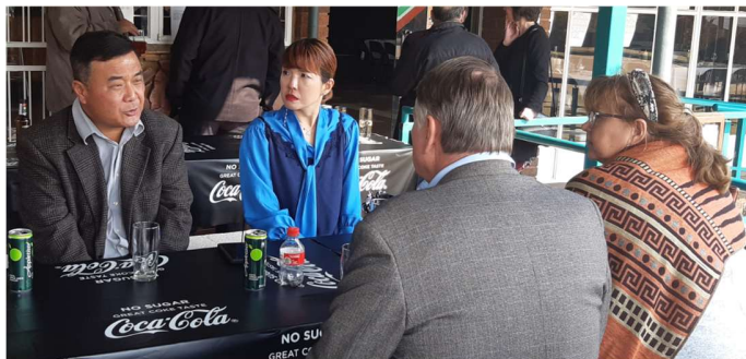
Members enjoying the get together before the formal ceremony starts.

This tradition makes you realise that whatever date and time you choose, the people are willing to compromise and attend. The spirit at the venue was as ever before. It seems that the Mindfulness Based Intervention Program (MBIP) introduced way back in 2013 is still paying off. Members gathered in a relaxed atmosphere, got rid of their stress and provided great support to those who were in the "dumps".