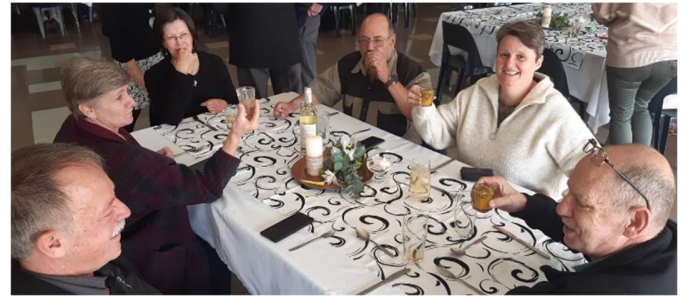
The smile on the faces reflects the friendship at this table.

Although a chill breeze reminded all attendees that winter is in full swing, the warm friendships compensated for it.