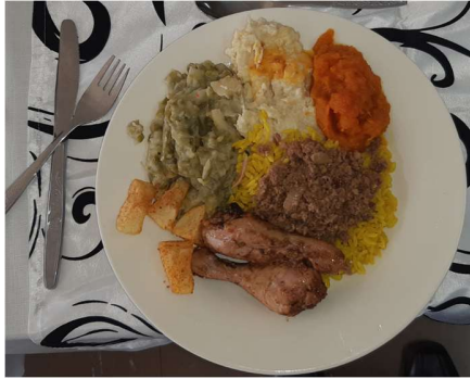
A Plate of "Regte Boere Kos"

The final result was that those who attended the lunch walked out with low stress impulses and normal body functions such as breathing, heart rate and immune function.